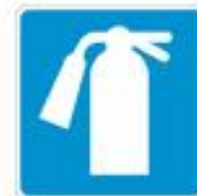
+ fire extinguisher