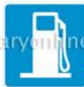
+ service station