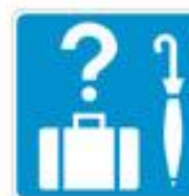
+ lost and found articles