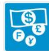
+ currency exchange