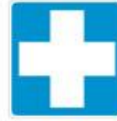
+ first aid